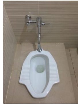
Gambar 3. Toilet jongkok dengan sistem pembilas otomatis di salah satu fakultas