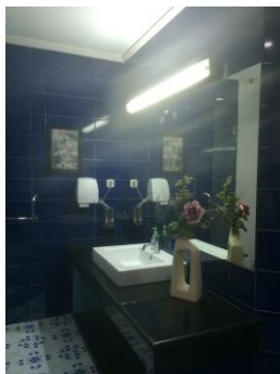
Gambar 2. Hall toilet publik unit kerja yang mewah

Teknologi dan biaya yang digunakan untuk membangun toilet juga menunjukkan bahwa Unhas tidak memiliki hambatan dalam pengadaan sentra-sentra toilet yang dikategorikan mahal dan mewah, walaupun fakta juga menunjukkan bahwa kualitas toilet yang mahal dan mewah tersebut tidak selalu berarti akan digunakan dan rawat dengan baik. Mirip dengan kisah orang-orang kaya di Banyumas yang memiliki toilet tetapi tidak digunakan sebagai tempat membuang limbah tubuh mereka. Toilet dibuat dengan tujuan untuk dipamerkan kepada orang-orang bahwa pemiliknya bukanlah orang miskin (Stein, 2009:554).